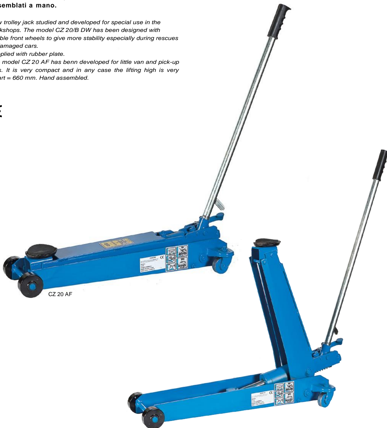
CZ 20 AF